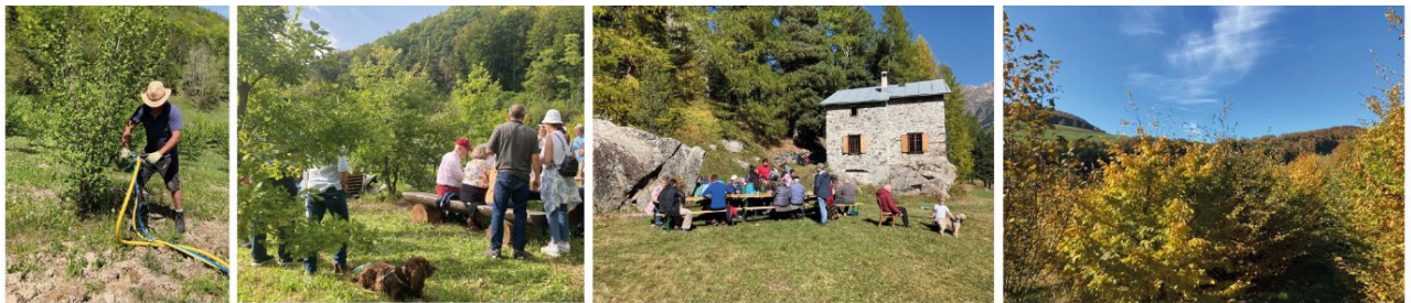
Bodenbelüftung Suchanlass in Thalheim Indian Summer Event im Engadin Herbstbeginn auf der Plantage

Noch ist dieses Jahr aber nicht vorbei und die Hoffnung stirbt bekanntlich zuletzt. Während diesen Tagen startet unsere Périgordsaison! Wir sind gespannt und hoffen, dass die Périgordtrüffel nicht so negativ wie die Burgundertrüffel auf die diesjährigen Wetterbedingungen reagiert haben. Wir lassen uns überraschen.